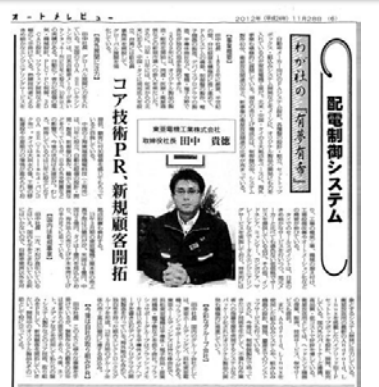
オートメレビューに掲載された記事

このように様々な事業を手掛けているが、盤製作などの顧客95%は従来からの固定客であり、今後、ネット、メディアなどを活用して私たちの盤・システム製作などのコア技術、取り組みをPRして、新規顧客を開拓していきたい。開発中のオリジナル製品もその一助として役に立ってくる。