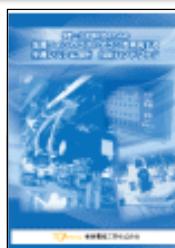
業界に特化した 技術ハンドブック

東亜電機工業が創業以来一貫して、強いものづくりを実現するためにファクトリーオートメーション技術を高めてまいりました。日々の実務の中で生産ラインの効率化・省人化・無人化に大きな成果を上げた事例を、カテゴリ毎にまとめ技術ハンドブックとして、この度発行いたしました。生産システムにおける知識や技術を基礎から、応用的な内容まで紹介しています。これまで東亜電機工業を支えていただきましたものづくり企業様のお役に立ちになれば幸いです。