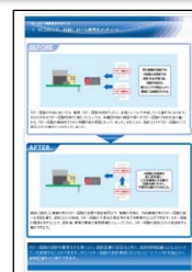
生産ラインの効率化・省人化・無人化を実現する 生産システム事例を30以上掲載された実学集